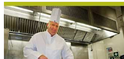
Servicios de Catering (13%)