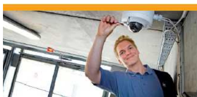
Servicios de Mantenimiento (20%)