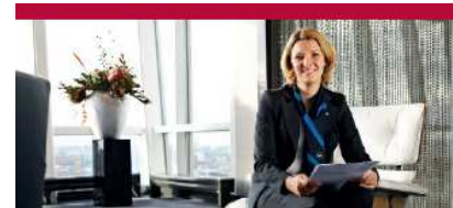
Servicios de Facility Management (3%)