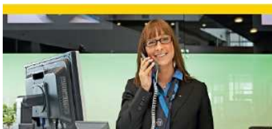
Servicios de Soporte (7%)