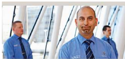
Servicios de Seguridad (7%)