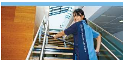
Servicios de Limpieza (50%)

Nuestro enfoque se centra en las necesidades de nuestros clientes y ofrece un amplio rango de facility services necesarios para cumplir con ellos. Con el fin de cumplir la propuesta, ISS ha pasado de ser un proveedor de limpieza a uno de amplio rango de servicios, incluyendo facility services (IFS). Esto se ilustra con nuestro creciente volumen de servicios que no sólo incluye limpieza, y que ahora constituye la mitad de nuestro negocio.